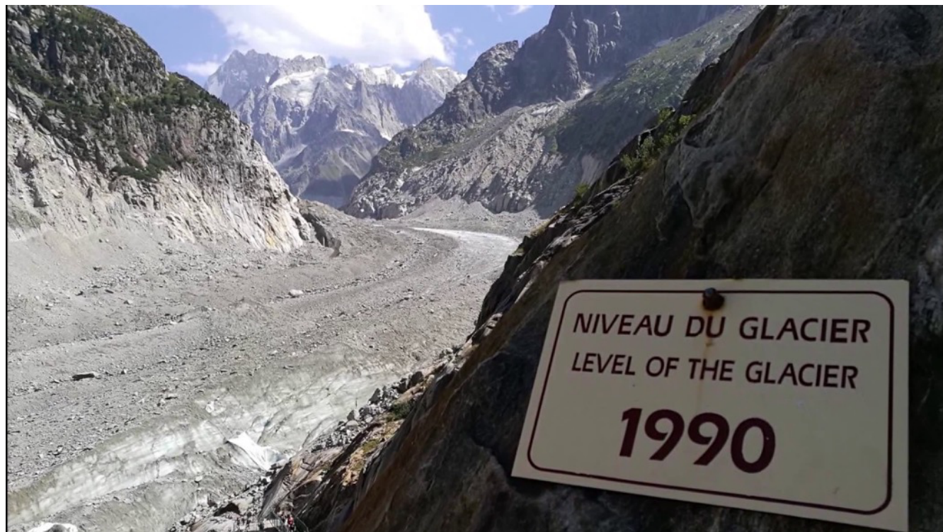
Photo : La Mer de Glace, de nos jours en été

Conséquence directe du réchauffement climatique en cours, la fonte des glaciers semble inéluctable. Dans son rapport paru début novembre 2022, l'UNESCO (Organisation des Nations Unies pour l'éducation, la science et la culture) estimait qu'un tiers des glaciers aujourd'hui classés au patrimoine mondial disparaîtraient d'ici 2050 (1) . Les glaciers français, eux aussi, ne font pas malheureusement pas exception : nous étudions dans ce problème leur déclin.